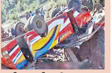
లోయలో పడిన బస్సు 21 మంది మృతి ఉదంపూర్ లో దుర్ఘటన

వెంకన్న దర్శనాల్లో వేసవి మార్పులు! తిరుమల, ఏప్రిల్ 20 ప్రభాతవార్త ప్రతినంది: సాధారణరోజుల్లోనే రోజుకు లక్షమంది వరకు తిరుమలకు వస్తున్న భక్తులు వెరసి సర్వ దర్శనానికి 18 గంటల సమయం పడుతోంది. ఇప్పుడు రానున్న వేసవి సెలవుల రద్దీని దృష్టిలో ఉంచుకుని టిటిడి బోర్డు, అధికారులు కీలక నిర్ణయాలు తీసుకునేందుకు సిద్ధమయ్యారు. వేసవిలో వివేకమైన భక్తుల రద్దీ కొనసాగే సూచనలు ఉండడంతో మే 1 నుండి జూలై వరకు పూర్తిగా ఆఫ్ లైన్ లో తిరుపతిలో కేటాయింపు దర్శనం సోమవారం తెల్లవారు జామున కన్నుల పండువగా ప్రారంభమైంది. దేవాలయ సంప్రదాయాన్ని అనుసరించి దేవస్థానం ఈ >>6 మే 1 నుంచి బ్రిక్ దర్శనం రద్దుకే టిటిడి నిర్ణయం ప్రాటోకాల్ వివేకాలు స్వయంగా వస్తేనే అనుమతి దర్శనాలు రద్దుకే టిటిడి అదనపు జి.ఎ. విరుమామిళ్ళు వెం కర్నూలు చౌదరి సిద్ధమయ్యారు. దేశవ్యాప్తంగా ఇప్పటికే చాలా రాష్ట్రాల్లో వేసవిసెలవులు అరంభమయ్యాయి. తెలుగురాష్ట్రాల్లో ఇంటర్, పది పరీక్షలు ముగియడం, ఇంటర్ పరీక్షాఫలితాలు వెలువడడంతో తరలివస్తున్నారు. ఈనెలలో భక్తుల దర్శనాలను పరిశీలిస్తే ఏప్రిల్ 1 న 69,649 మంది భక్తులు మహామఠంలో శ్రీవారిని దర్శనం చేసుకున్నారు. 2 న 62,642 మంది, 3 వ తేదీ 68,445 మంది, 4 వ తేదీ 80,841 మంది భక్తులు దర్శనం చేయించారు. 5 వ తేదీ 83,271 మందికి, 11 వ తేదీ 81,288 మంది భక్తులు, 18 న 78,586 మంది భక్తులు, 14 న 79,426 మంది భక్తులు, ఆదివారం రోజు 77 వేల మంది భక్తులు, సోమవారం సాయంత్రం వరకు 42 వేల మంది భక్తులు శ్రీవారి దర్శనం చేయించారు. ఇంకా మరో 20 వేల మంది వరకు భక్తులు కంపార్ట్ మెంట్ లో నిరీక్షిస్తున్నారు. ఉదయం వేళ ఏకంగా వివిధ డిపార్ట్ మెంట్లకు 2.30 గంటల నుండి >>6