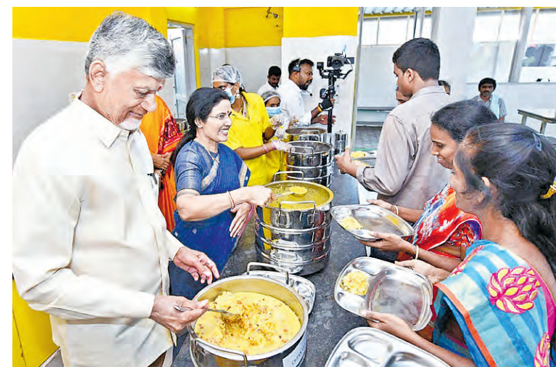
సోమవారం విజయవాడ పటమల అన్న క్యాంటీన్లో తన పుట్టిన రోజు సందర్భంగా సతీసమేతంగా అన్నాహారం వడ్డిస్తున్న సిఎం చంద్రబాబు